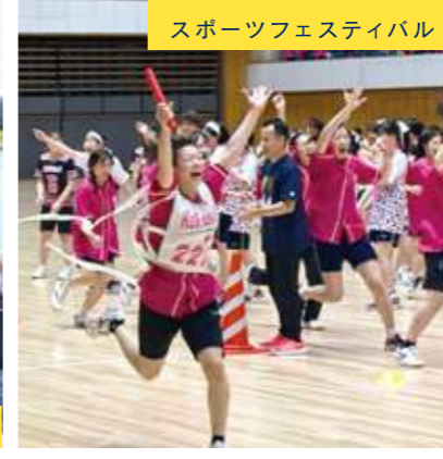
スポーツフェスティバル