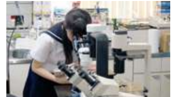
北海道大学研究室訪問